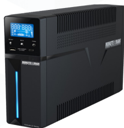
Confier à LG