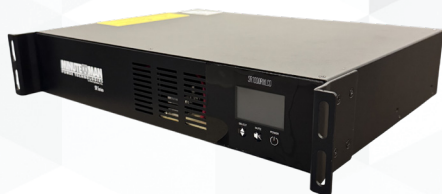
Étagère peu profonde

La Loi sur l'autorisation de la défense nationale (NDAA) établit les normes fédérales pour les équipements utilisés dans les applications gouvernementales et sensibles en matière de sécurité. La gamme complète de solutions de protection électrique Minuteman répond aux exigences de la NDAA. Idéales pour les projets fédéraux, provinciaux, municipaux, éducatifs, d'entreprises et d'infrastructures critiques, les solutions Minuteman garantissent conformité et fiabilité.